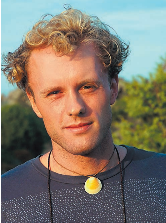
האריס. "התכונתי ללמוד אמנות, אבל איכשהו היררדתי למדעי המחשב"